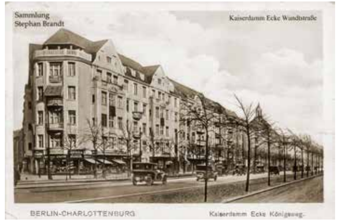
Historische Postkarte vom Kaiserdamm.