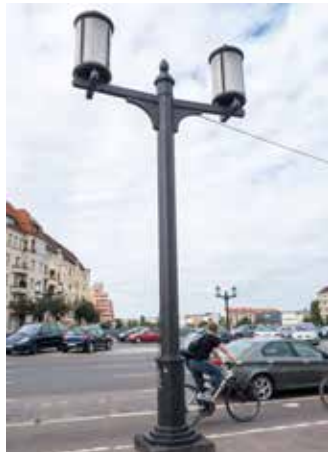
Die bis heute erhaltenen Kandelaber wurden von Albert Speer geschaffen.

Besonderes Highlight dürften die drei Stadtpaziergänge rund um das Geburtstagskind Kaiserdamm werden, mit amtierendem Bezirksbürgermeis-