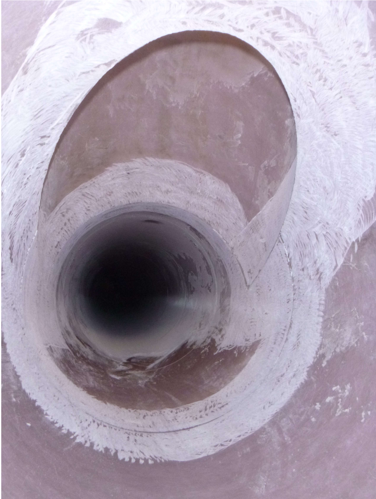
Eingebaute und per Hand in zehn Schichten laminierte Inlinerrohre in einem Dükerast. Dafür werden an den Verbindungsstellen zehn Schichten glasfaserverstärkter Kunststoff per Hand aufgetragen. Jede Schicht muss trocknen, alles geht nur, wenn es nicht regnet.