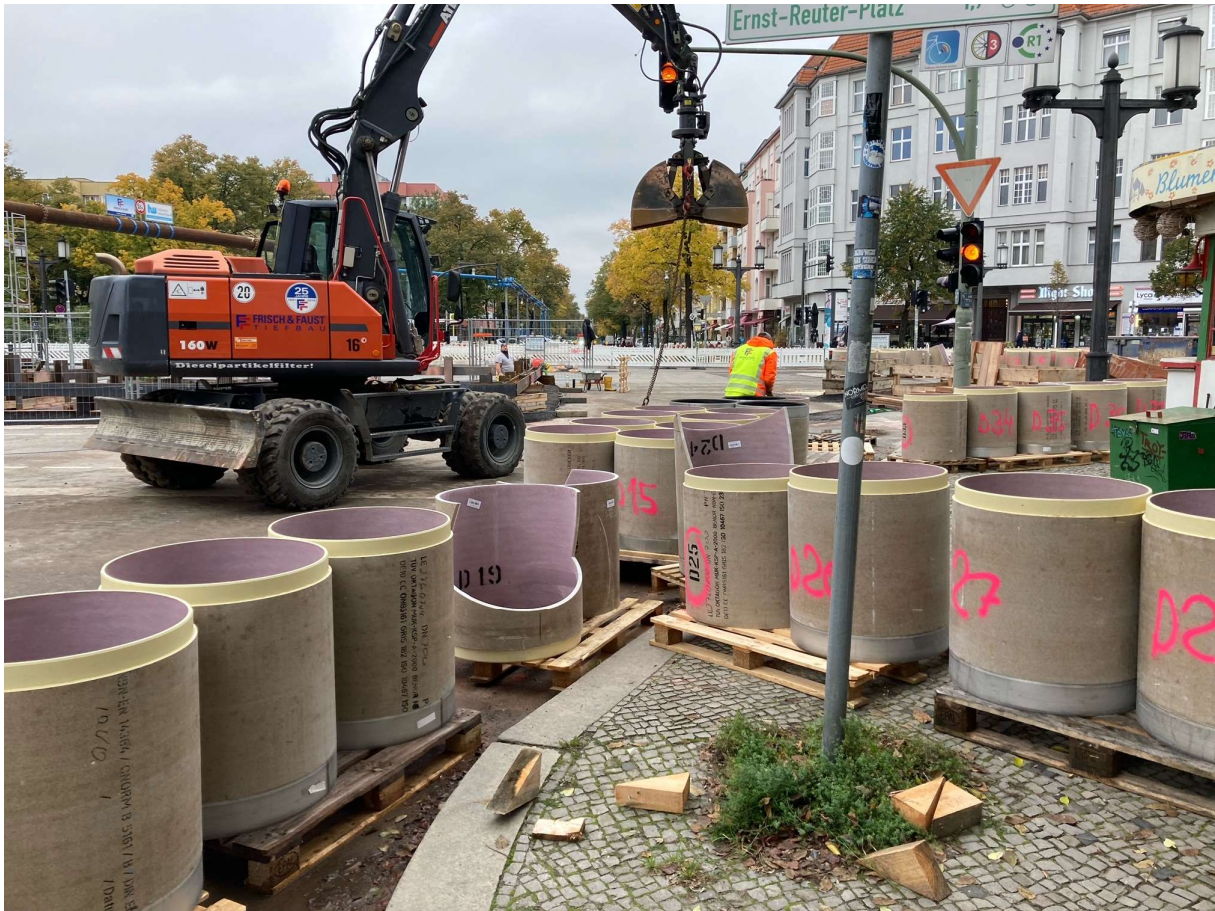
Inliner vor dem Einbau: Jedes Stück eine Maßanfertigung.